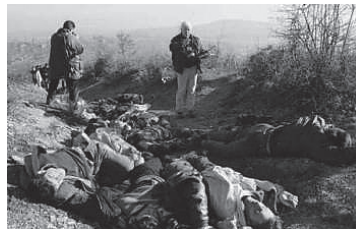
Slika 4: Tela žrtava masovnog ubistva u Gornjem Obrinju/ Obri e Epërme.