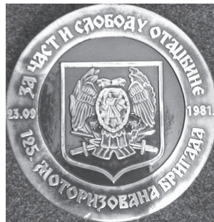
Slika 1: Obeležje 125. mtbr.