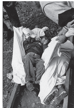
Slika 5: Žrtve zločina u Gornjem Obrinju/ Obri e Epërme.

66. 19 članova porodice Deliu se sklonilo na mesto zvano Koreniti Šumarak/Zabeli i Renjave, na kilometar od mahale Deliu. Na tom mestu su postavili najlonski šator. M.A. je ispričao istraživačima FHP-a kako je tog dana sa mesta koje se nalazilo na oko 200-300 metara od šatora gde se sklonila porodica Deliu čuo „glasove žene i dece, odjednom su počeli svi da vrište najviše što je moguće... To vrištanje je trajalo oko pola sata. Posle toga se nisu čuli nikakvi glasovi.“ 70