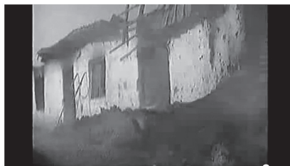
Slika 3: Spaljena kuća u Ošljanu/Oshlan, CNN „Kosovo: Oshlan Massaker“.